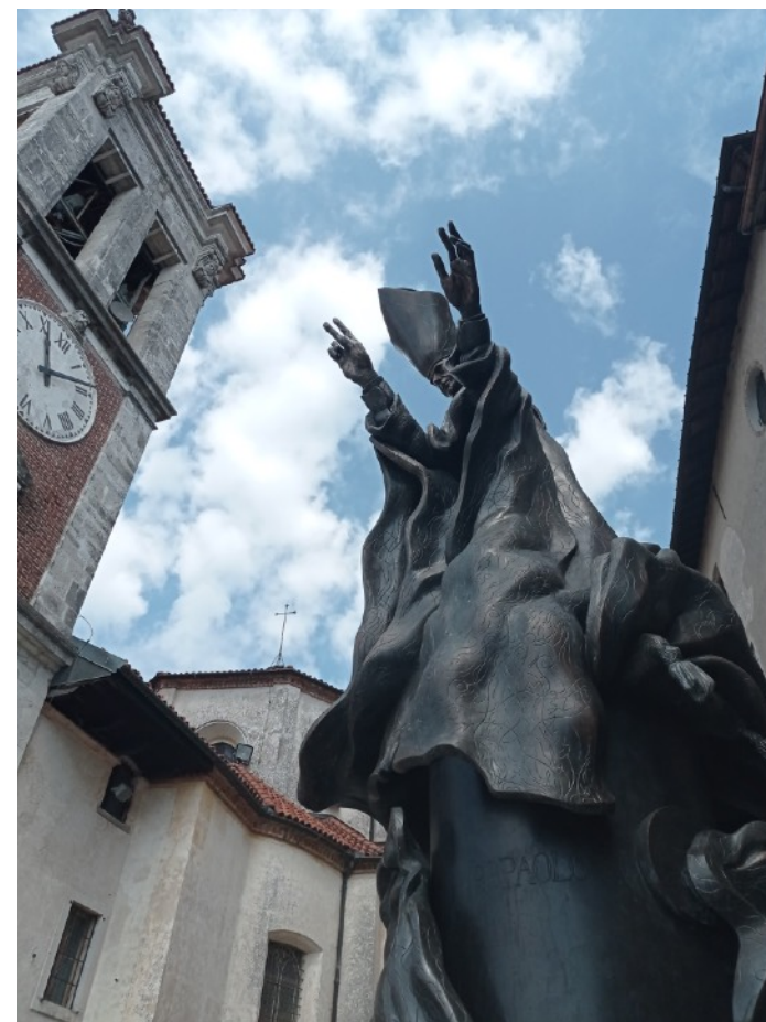
Florianò Bodini, Paolo VI , 1968, bronzo patinato, Sacro Monte di Varese