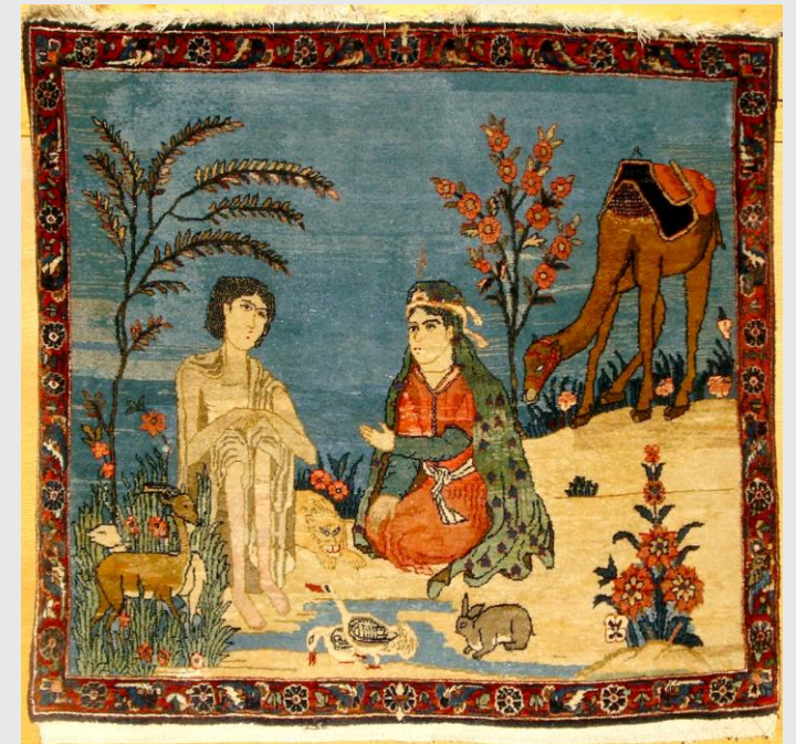
Figure simboliche della letteratura mistica