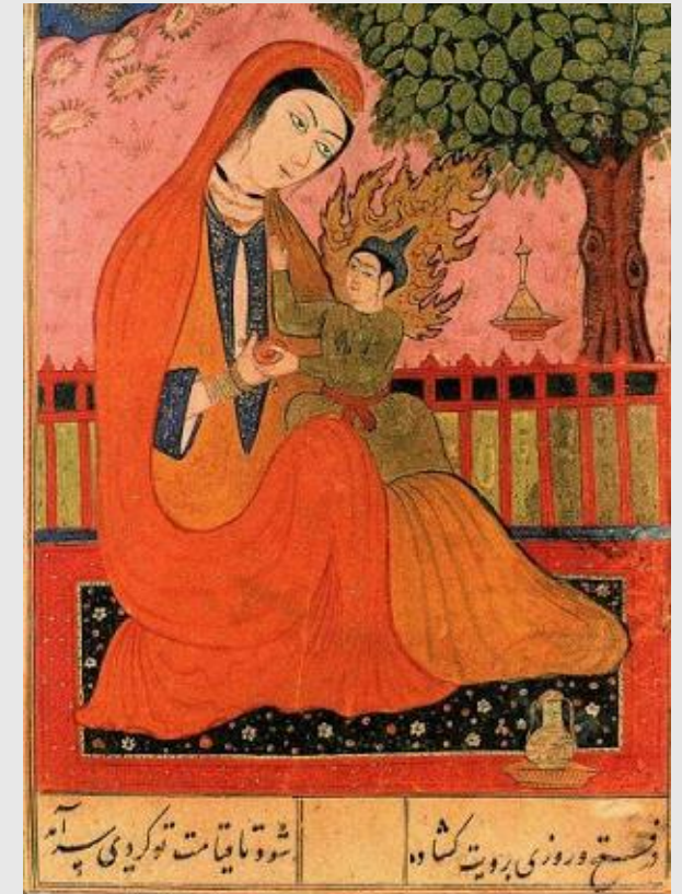
Figure coraniche e della storia sacra: le «Quattro donne perfette»